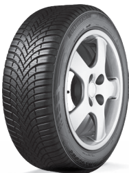
MULTISEASON GEN 02