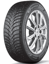
BLIZZAK SPIKE 3