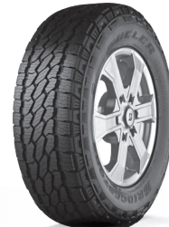
DUELER ALL-TERRAIN A/T002