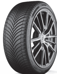
TURANZA ALL SEASON 6