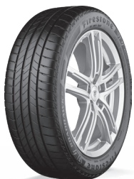
ROADHAWK 2 JAUNUMS