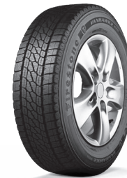
VANHAWK 2 WINTER