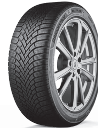
BLIZZAK 6 JAUNUMS