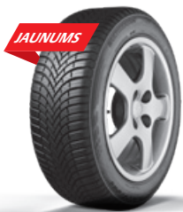
MULTISEASON GEN 02