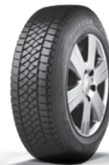
BLIZZAK W8 10