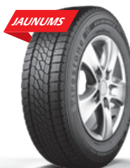
VANHAWK 2 WINTER