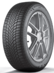
WEATHER CONTROL A005